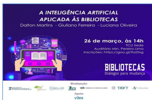
Figura 6 – Cartaz do workshop Inteligência artificial e bibliotecas