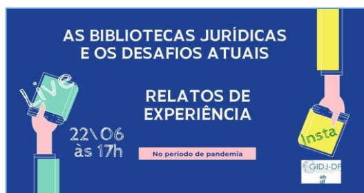
Figura 8 – Cartaz da live As bibliotecas jurídicas e os desafios atuais