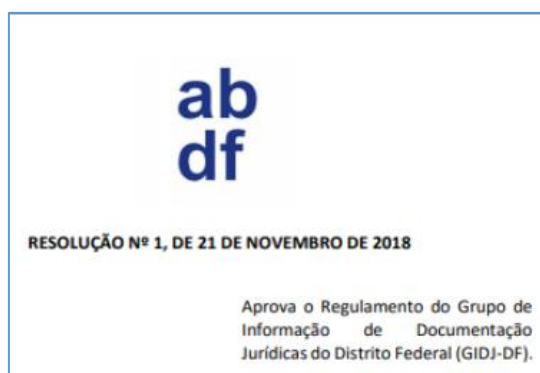
Figura 2 - Regulamento do GIDJ-DF