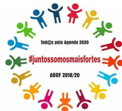
Figura 11 - Logo da Chapa ABDF Gestão 2018-2020

O espírito de colaboração prevaleceu nesses três anos de trabalho do Grupo. Esperamos que as futuras gestões do GIDJ-DF também sejam movidas pela união de todos os atores envolvidos no desempenho, na gestão e no fortalecimento das unidades de informação jurídica.