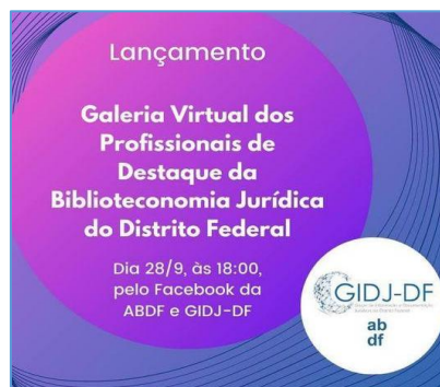
Figura 10 – Cartaz do evento de lançamento Galeria Virtual Profissionais de Destaque