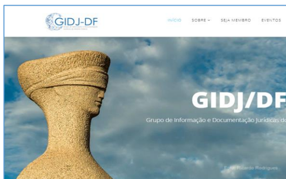
Figura 5 - Site do GIDJ-DF