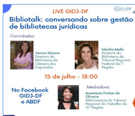
Figura 9 – Cartaz da live Bibliotalk: conversando sobre gestão de bibliotecas jurídicas