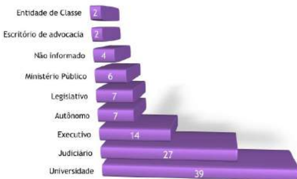
Empregador dos participantes